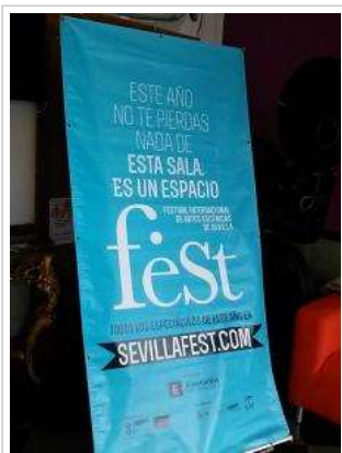
Cartel oficial de la XI edición del feSt.

Como siempre, os deseamos ¡mucho mierda!