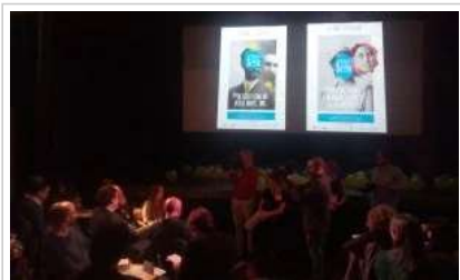
Numerosos medios de comunicación se acercaron hasta La Imperdible para la presentación del feSt.

El festival quiere que este año los asistentes puedan vivir el teatro desde dentro. Por ello, está previsto que se invite al público al backstage ; a que asista a los preparativos de un estreno, a que viva los ensayos antes de la función, a que repase con los actores y equipo la obra en los pases técnicos, a que conozca a los directores y los actores de las obras.