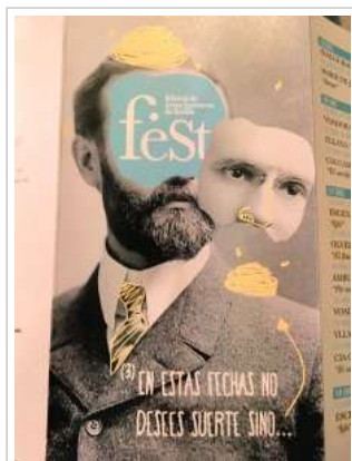
Uno de los carteles para promocionar el feSt 2016.

El Festival de las Artes Escénicas de Sevilla (feSt) se desarrollará entre el 14 de diciembre de 2016 y el 24 de enero de 2017, con una edición dirigida a los más jóvenes para celebrar la Navidad. Están programadas 77 funciones de 28 compañías diferentes.