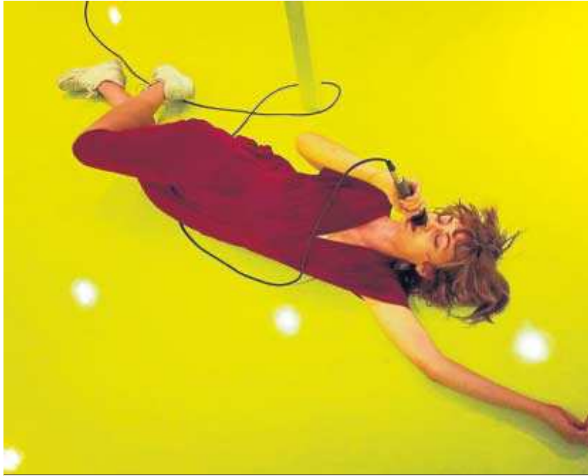
'Invisibles. La ciudad de Asterión', de la compañía sevillana Teatro a Pelo.

También se puede ir a la Sala Cero hoy y mañana a las 18:30 para ver Hansel y Gretel , un cuento musical de La Coja Producciones.