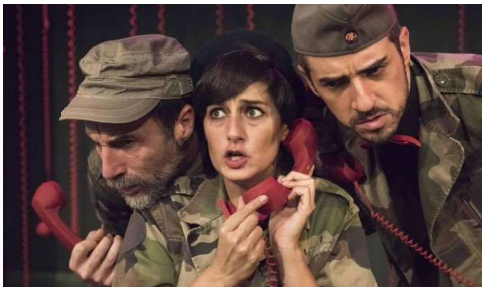
Un momento de la obra 'Manténgase a la espera'.

DOLORES GUERRERO / SEVILLA / 08 ENE 2017 / 19:12 H - ACTUALIZADO: 08 ENE 2017 / 19:16 H.