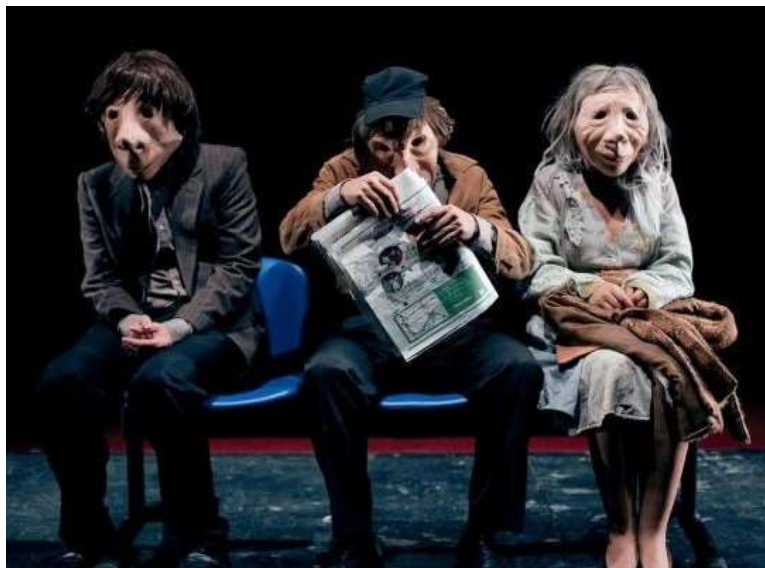
Un momento de la representación.

DOLORES GUERRERO / SEVILLA / 23 DIC 2016 / 21:43 H - ACTUALIZADO: 23 DIC 2016 / 21:49 H.