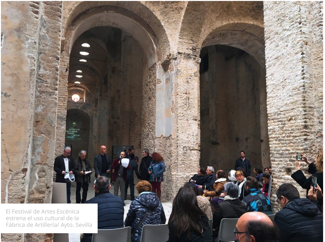
El Festival de Artes Escénica estrena el uso cultural de la Fábrica de Artillería/ Ayto. Sevilla